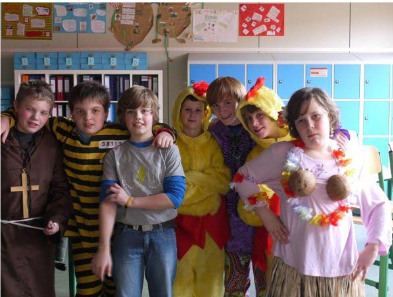
Große und kleine Jecken